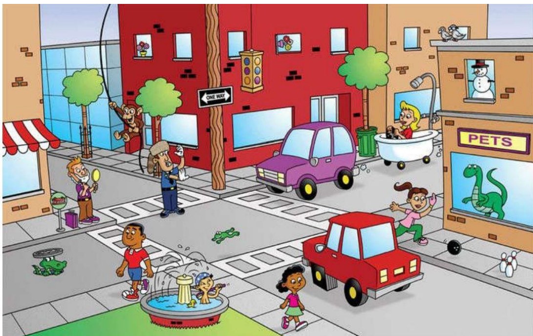
Рис.2. Ошибки художника

На примере анализа событий вокруг девочки, играющей с мячом, алгоритм рассуждений может быть представлен следующим образом: