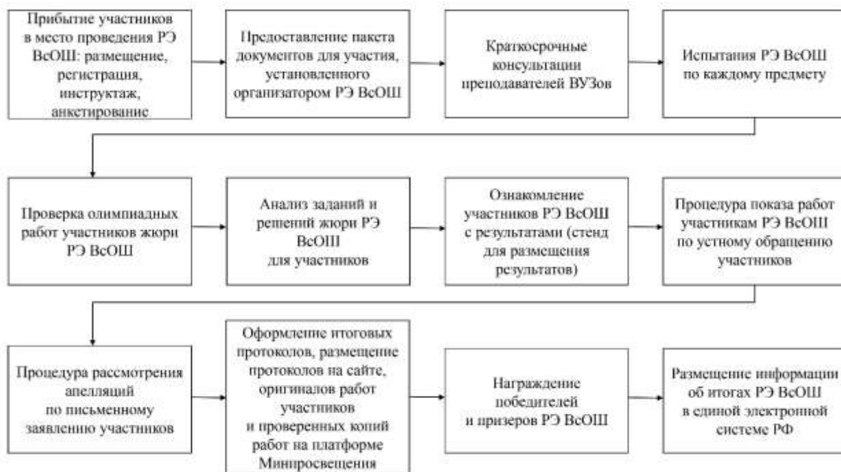
Рис.2. Общая схема проведения РЭ ВСОШ.