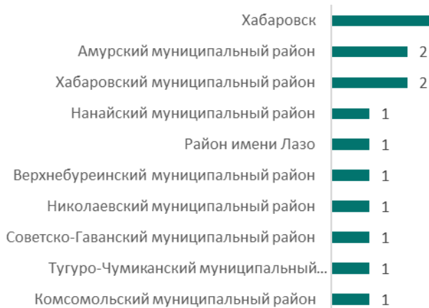
Представление опыта педагогов (кол-во ОО)

Педагоги, показывающие стабильно хорошие результаты