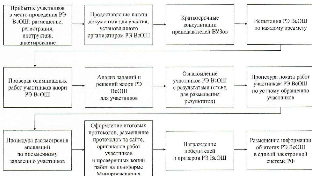
Рис.2. Общая схема проведения РЭ ВсОШ.

16. Общая схема процедуры проведения РЭ ВсОШ отражена на рисунке 2.