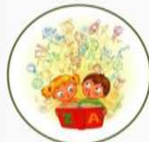
Игры на логику и мышление