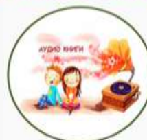
Аудио рассказы для детей