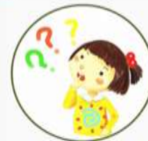
Игры на внимание и память