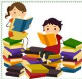
Там, где живут книги

Где мы с тобой будем читать вслух книжки и рассматривать иллюстрации, смотреть и рассказывать "Историю из чемодана", пить чай, мастерить и рисовать, играть и смотреть полезные мультимики, танцевать и делать зарядку, узнавать много нового и интересного.